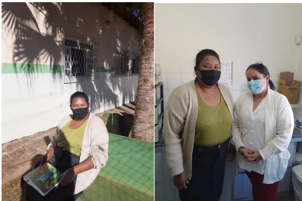
Moradora M.A.F no CAPS