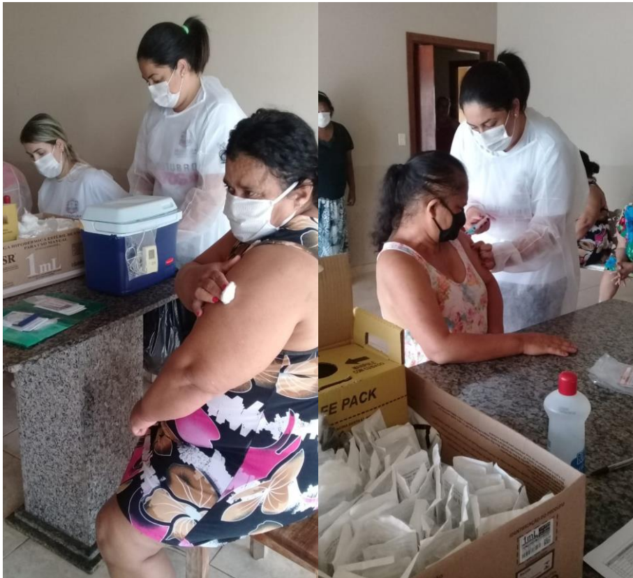
Segunda dose da vacina Coronavac (17/02/2021)