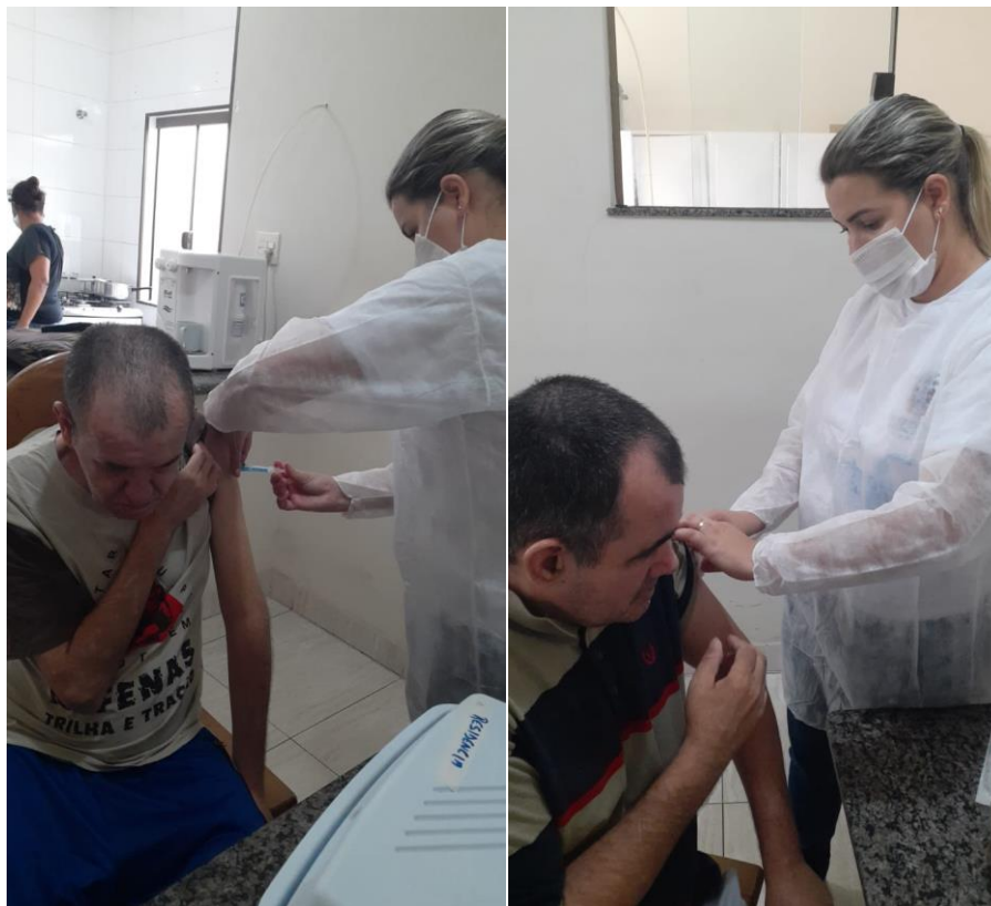
Primeira dose da vacina Coronavac (02/02/2021)