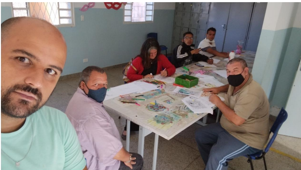
Oficina de desenhos