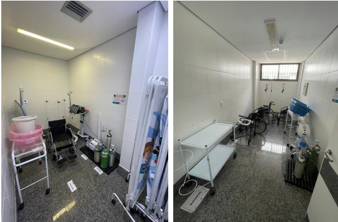
Salas de equipamentos existentes para referência