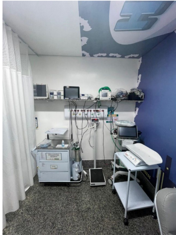
Leito de UTI PEDIÁTRICA existente para referência