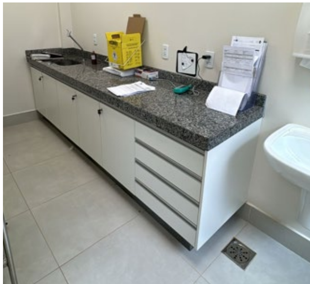
Armário sob bancada para referência