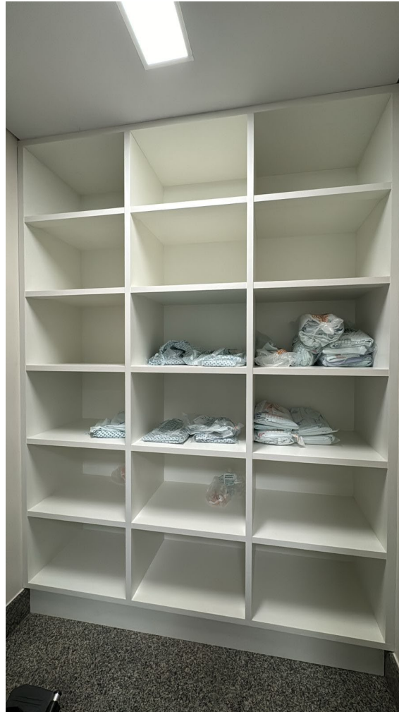
Sala de guarda de materiais esterelizados existente para referência