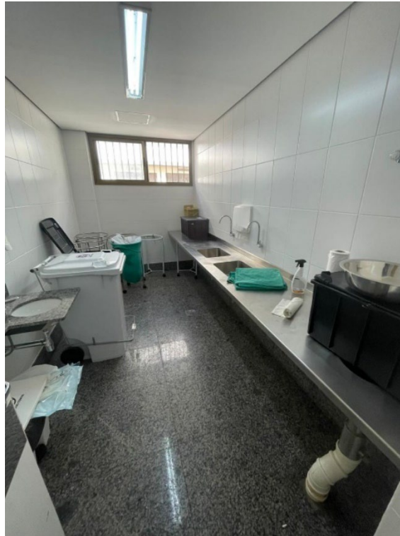
Sala de Utilidades existente para referência.